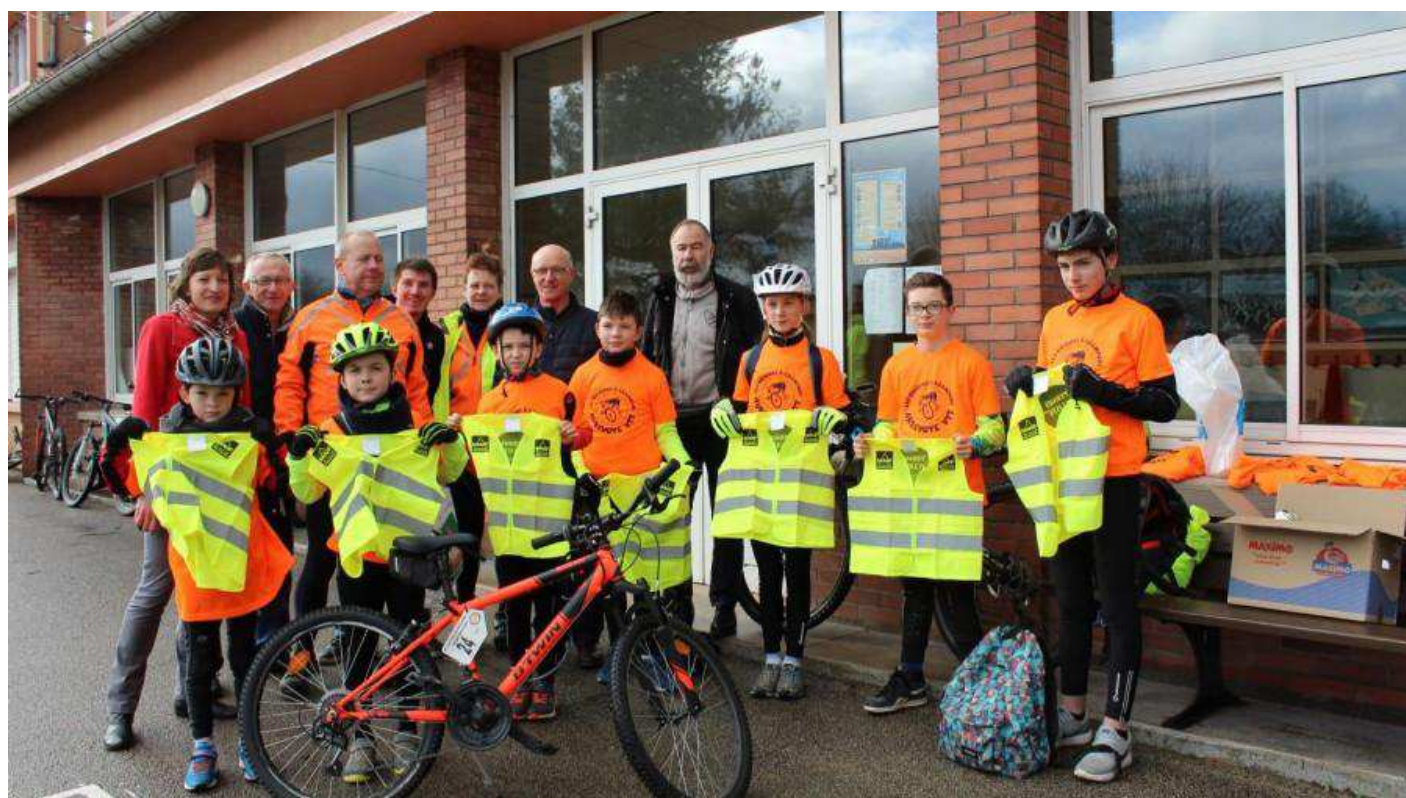
L'école de cyclotourisme, équipée de nouveaux gilets

Publié 09/02/2018 22:03 | Mise à jour 09/02/2018 22:03